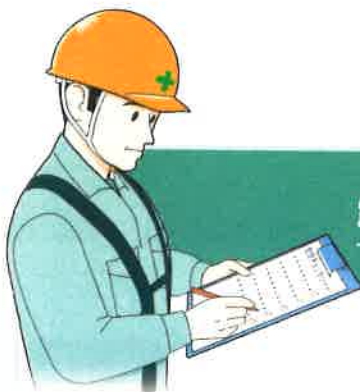
震災被災地の建設業の死傷者数と指導現場数

建設現場において、安全衛生の助言等を受けたい方は、お気軽に各支援センター（6ページ参照）へお問い合わせください。料金はすべて【無料】です。